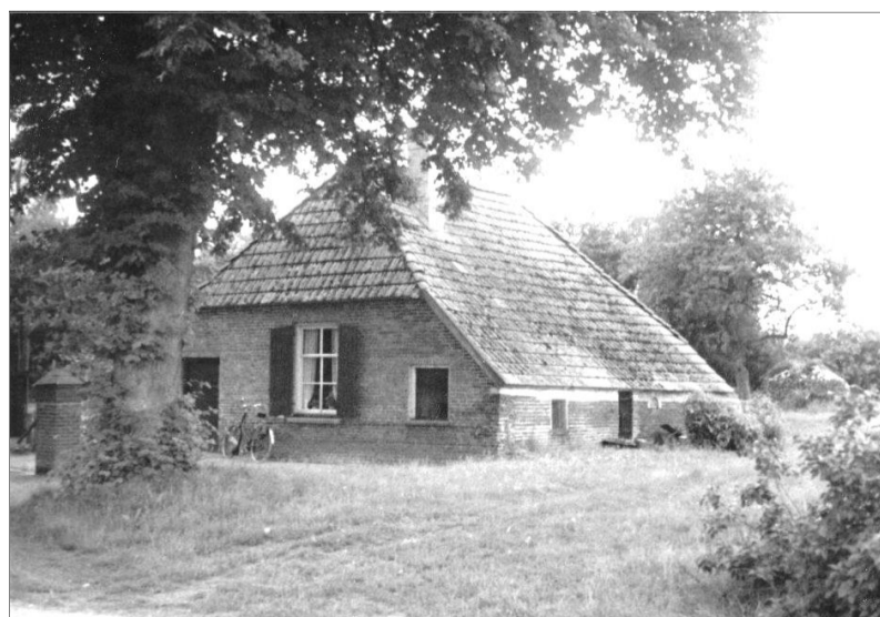
Het plaatsje Dennenboom in de Wildenborch