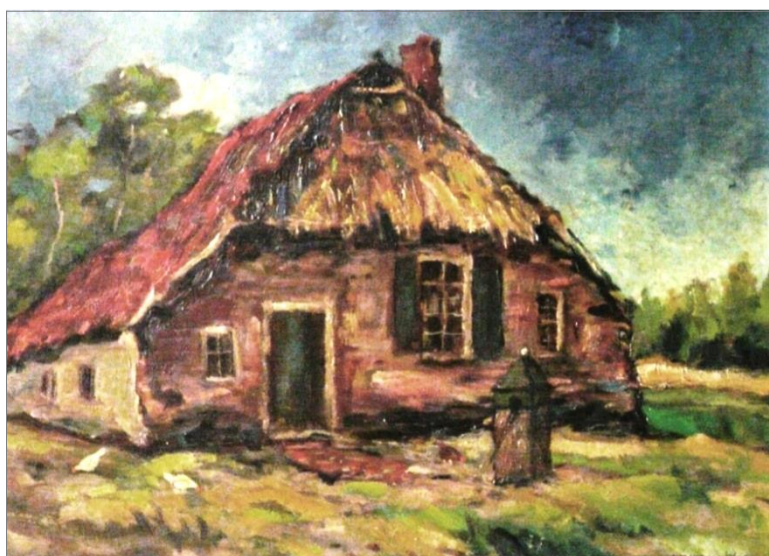
(schilderij: A.M. Jörissen, 1960)

De verstening van de muren en dakpannen is een ontwikkeling van de laatste paar eeuwen, toen de welvaart op het platteland steeg.