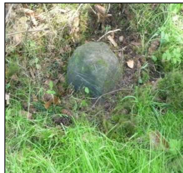
Links de verloren gewaande paal bij de Goedenberg bij de terreingrens met huisnummer 11 De andere 2 gebroken paaldelen op het terrein van huisnummer 11

Dan tot slot nog twee halve, wit gekalkte palen die nu als schamppalen dienst doen bij de erf inrit van boerderij Enghuizerslag aan de Broekstraat. Ook hiervan weten we niet wat de oorspronkelijke standplaats is geweest. Er zijn in ons gebied dus nog vele palen te vinden, waaronder een aantal halve palen of koppen, terwijl een aantal plaatsen bekend is waar vroeger palen gestaan hebben.