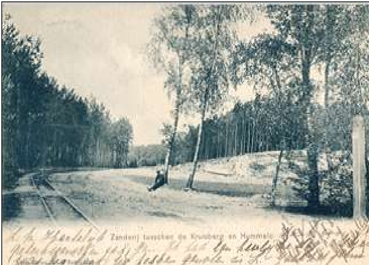
Zanderij tussen de Kruisberg en Hummelo (1905) met rechts een jachtpaal

meeste boerderijen en gronden in de voormalige marke Hummelo zodat men er als eigenaar van de terreinen het jachtrecht ongestoord kon uitoefenen.